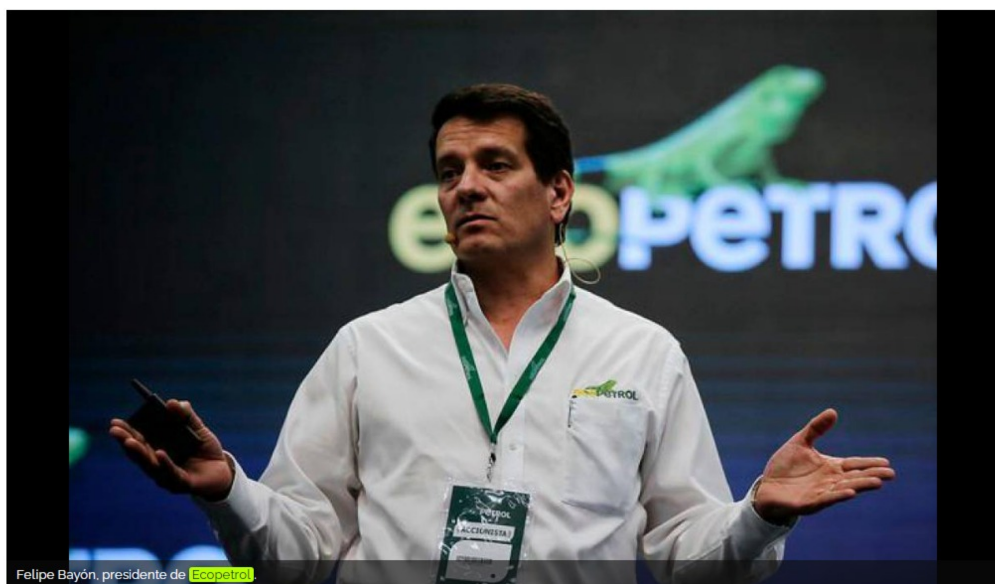
Felipe Bayón, presidente de Ecopetrol.

La Asamblea aprobó el proyecto de distribución de las utilidades, que incluye un pago de $17 por acción el próximo 22 de abril.