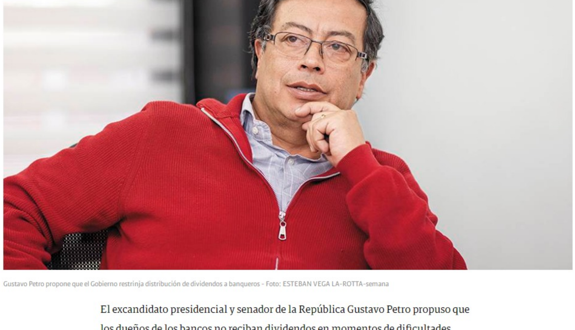
Gustavo Petro propone que el Gobierno restrinja distribución de dividendos a banqueros

El excandidato presidencial y senador de la República Gustavo Petro propuso que los dueños de los bancos no reciban dividendos en momentos de dificultades económicas como la actual.