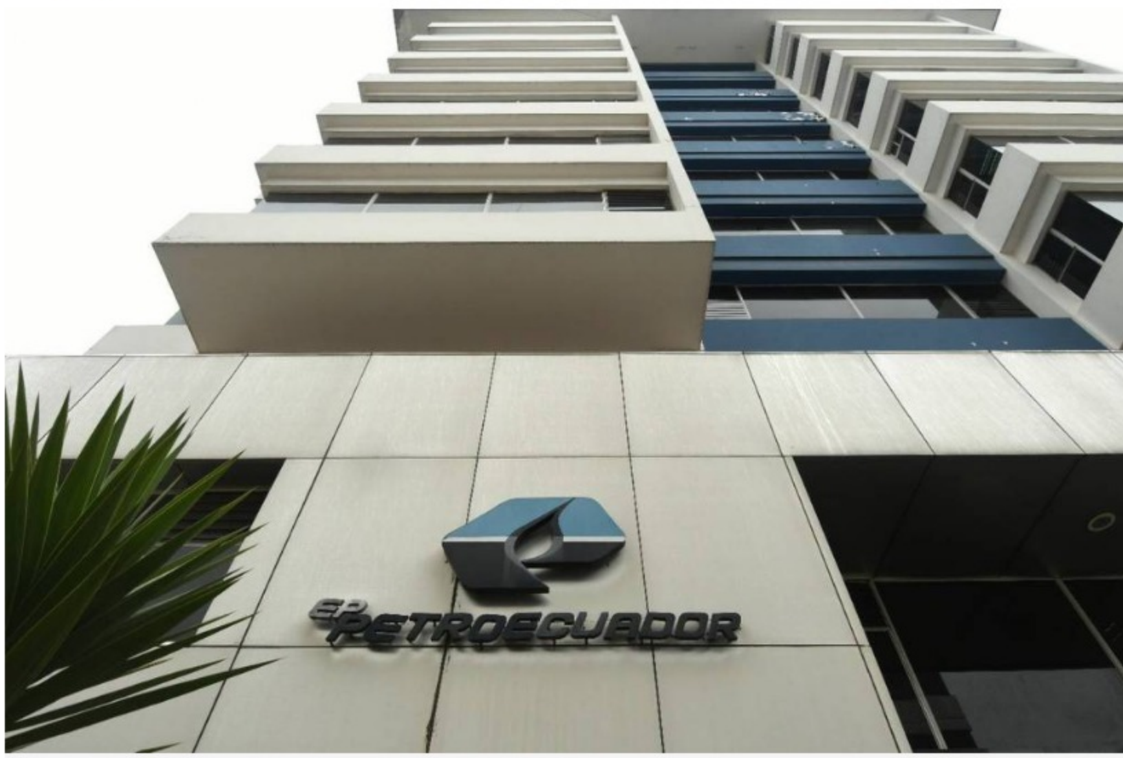
El pasado miércoles, EP Petroecuador anunció que inició los trámites para un nuevo concurso cuyo objetivo es asegurar los bienes valorados en cerca de $ 6.000 millones de esa empresa estatal.