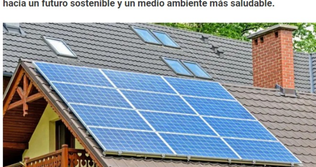
Alemania amplió los límites para poder compartir la electricidad autogenerada.

Aquí, la energía solar se encuentra en una posición única para avanzar hacia un futuro sostenible y un medio ambiente más saludable .