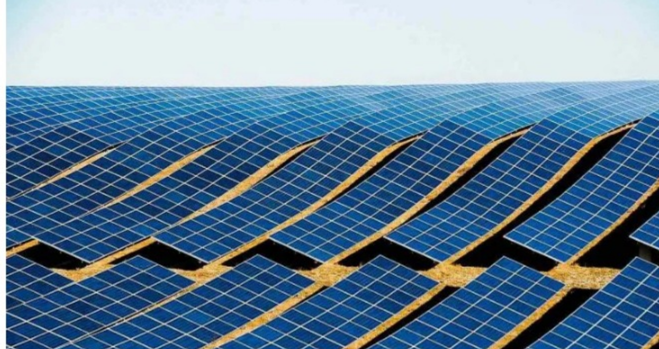
Un estudio de WoodMac muestra que los costos de la energía solar podrían caer entre un 15% y un 25% durante la próxima década.