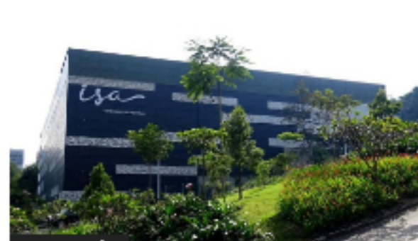
Asamblea de ISA aprobó dividendos y elección de nueva Junta Directiva