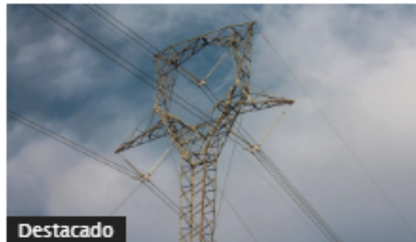
Gobierno pide aprobar "con urgencia" proyecto de transformación energética en Colombia