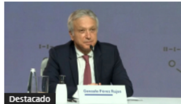
Asamblea de Grupo Sura aprobó dividendos, se mantiene Junta Directiva