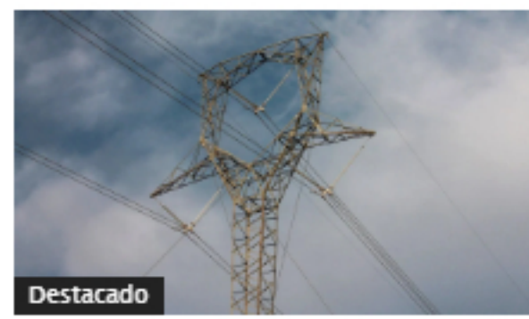
Gobierno pide aprobar "con urgencia" proyecto de transformación energética en Colombia