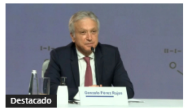
Asamblea de Grupo Sura aprobó dividendos, se mantiene Junta Directiva