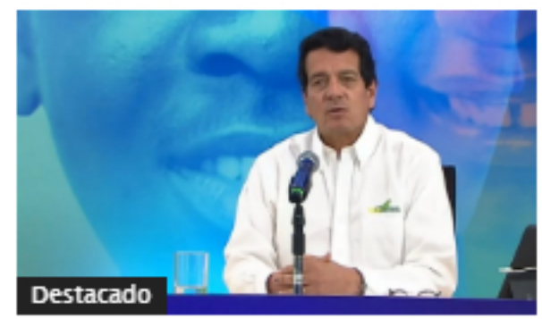
Ecopetrol aprobó dividendos de $17 por acción para 2021