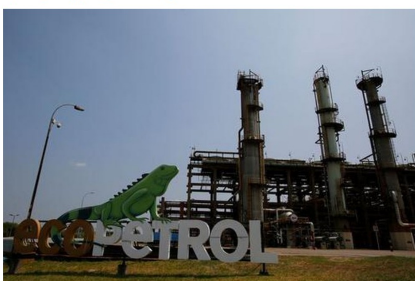
Foto de archivo. Imagen de la refinería de Ecopetrol en Barrancabermeja, Colombia, 1 de marzo, 2017.

El Grupo Ecopetrol anunció, este jueves 25 de marzo, su meta de cero emisiones netas de carbono para 2050 , en línea con su compromiso para mitigar el cambio climático y avanzar en la transición energética y en su agenda de sosTECnibilidad.