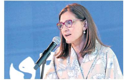
Ministerio de Transporte

En un mes inician obras en la Malla Vial del Meta