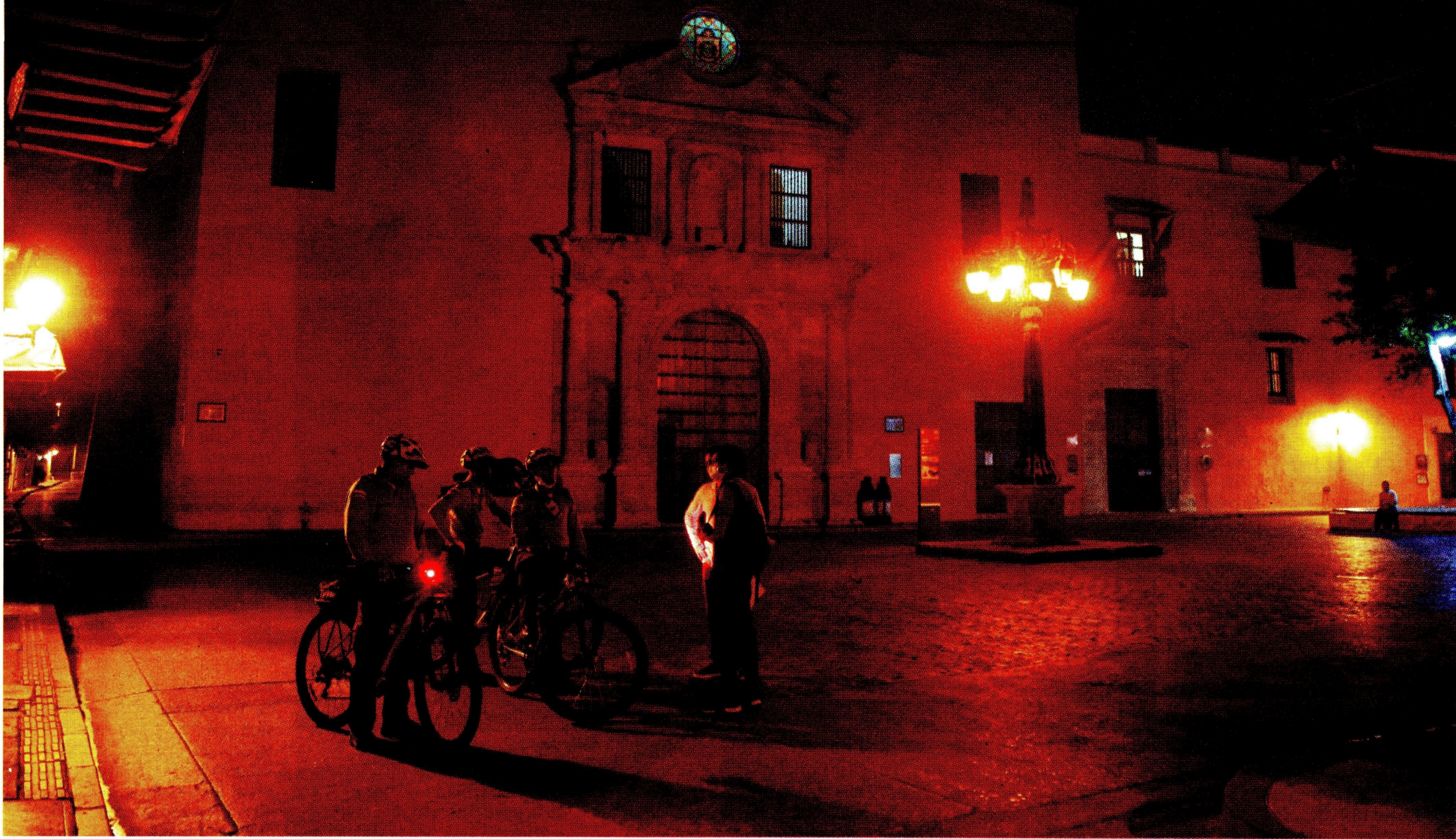
Las restricciones aplicarán para los fines de semana del viernes 26 de marzo al lunes 29 de marzo y del 31 de marzo al 5 de abril.

El Gobierno anunció medidas para evitar un nuevo pico de contagios por COVID-19 en Semana Santa. Habrá restricciones a la movilidad en las noches y pico y cédula en aquellos municipios donde la ocupación de las UCI esté por encima del 70 %. / Vivir p. 5