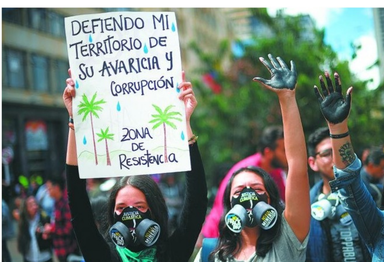
Uno de los objetivos del Centro de Transparencia es reforzar la confianza de las comunidades ante estos proyectos.