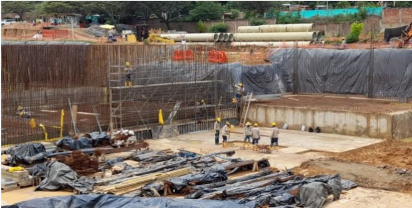
La estructura del edificio de bombas progresa en 35 % y la subestación eléctrica en 13 %. La línea de impulsión tiene instalación acumulada de tubería de 12 kilómetros.

Inicio / Destacado / ACUEDUCTO METROPOLITANO. Avance de 64 % en las obras del Sub-proyecto 1