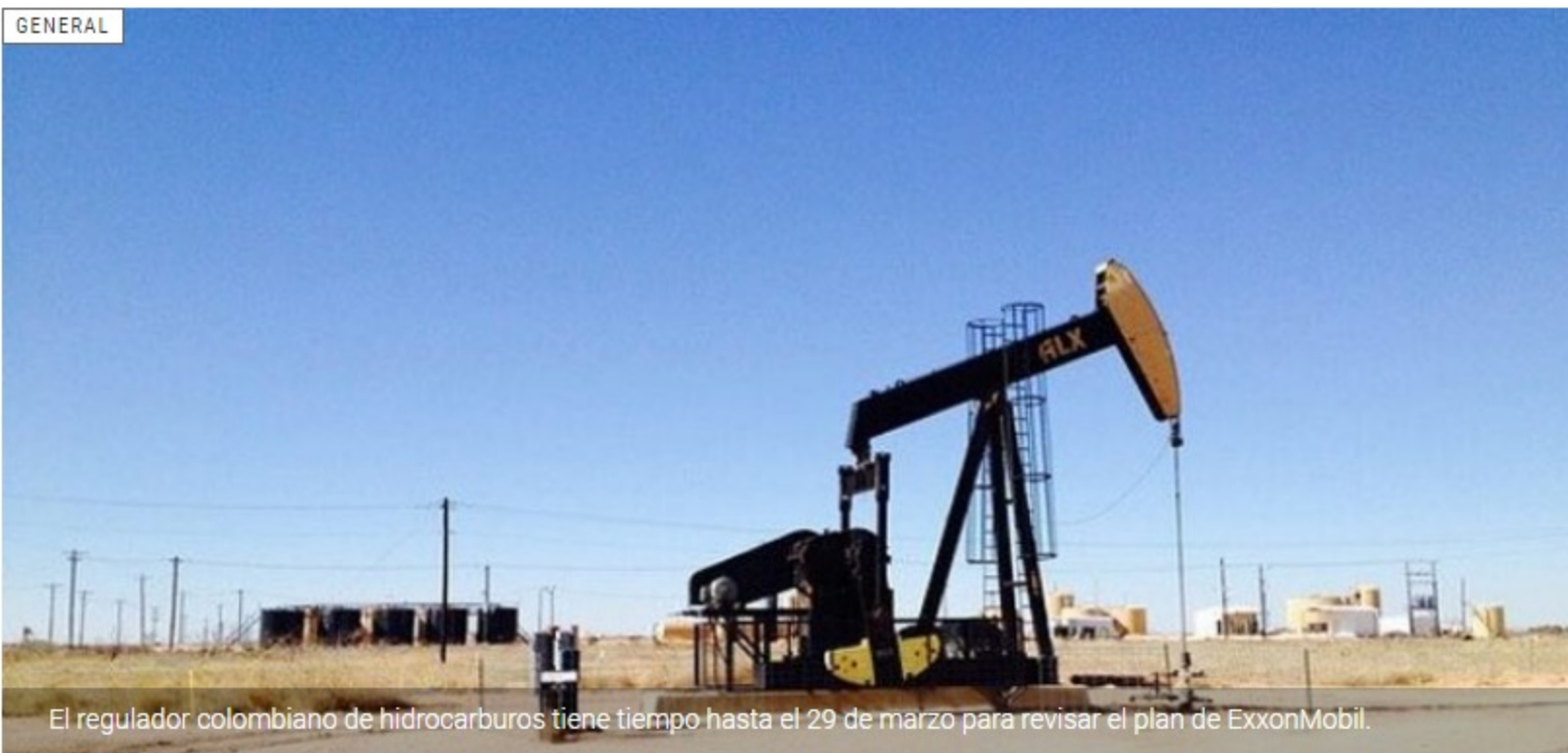
El regulador colombiano de hidrocarburos tiene tiempo hasta el 29 de marzo para revisar el plan de ExxonMobil.

ExxonMobil ha presentado una solicitud en Colombia para solicitar la aprobación de un proyecto piloto de fracking en la cuenca Valle Medio del Magdalena en el país sudamericano.