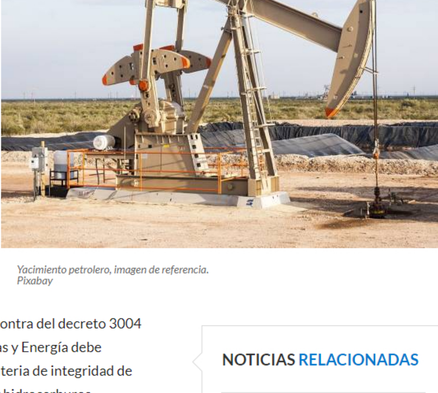
Yacimiento petrolero. Imagen de referencia.

No obstante, el proceso que lleva un poco más de cuatro años en la corporación judicial ha tenido varios giros. El caso empezó con dos procesos puntuales. Si bien las dos acciones legales se interpusieron en el mismo momento y por la misma persona, Esteban Lagos González, cada caso tomó un rumbo diferente.