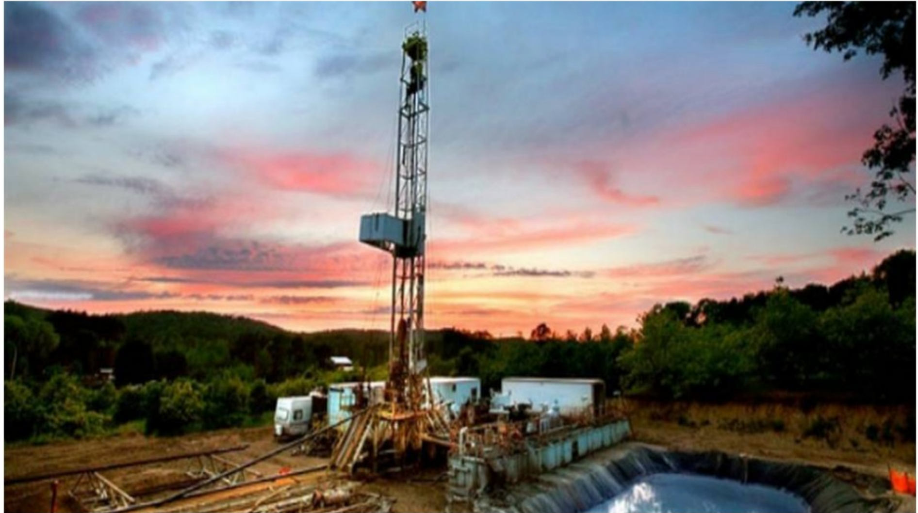
Operación de fracking - Foto:

La Sección Tercera del Consejo de Estado iniciará la discusión que podría abrirle o cerrarle la puerta al fracking, la práctica de fracturación hidráulica en Colombia para extraer petróleo. Hace pocos días SEMANA informó por qué el 2021 es un año crucial para el en Colombia; en primer lugar, ya se firmó el primer contrato (con Ecopetrol) para llevar a cabo los proyectos pilotos de investigación y se espera que en las próximas semanas se firmen por lo menos otros dos contratos.