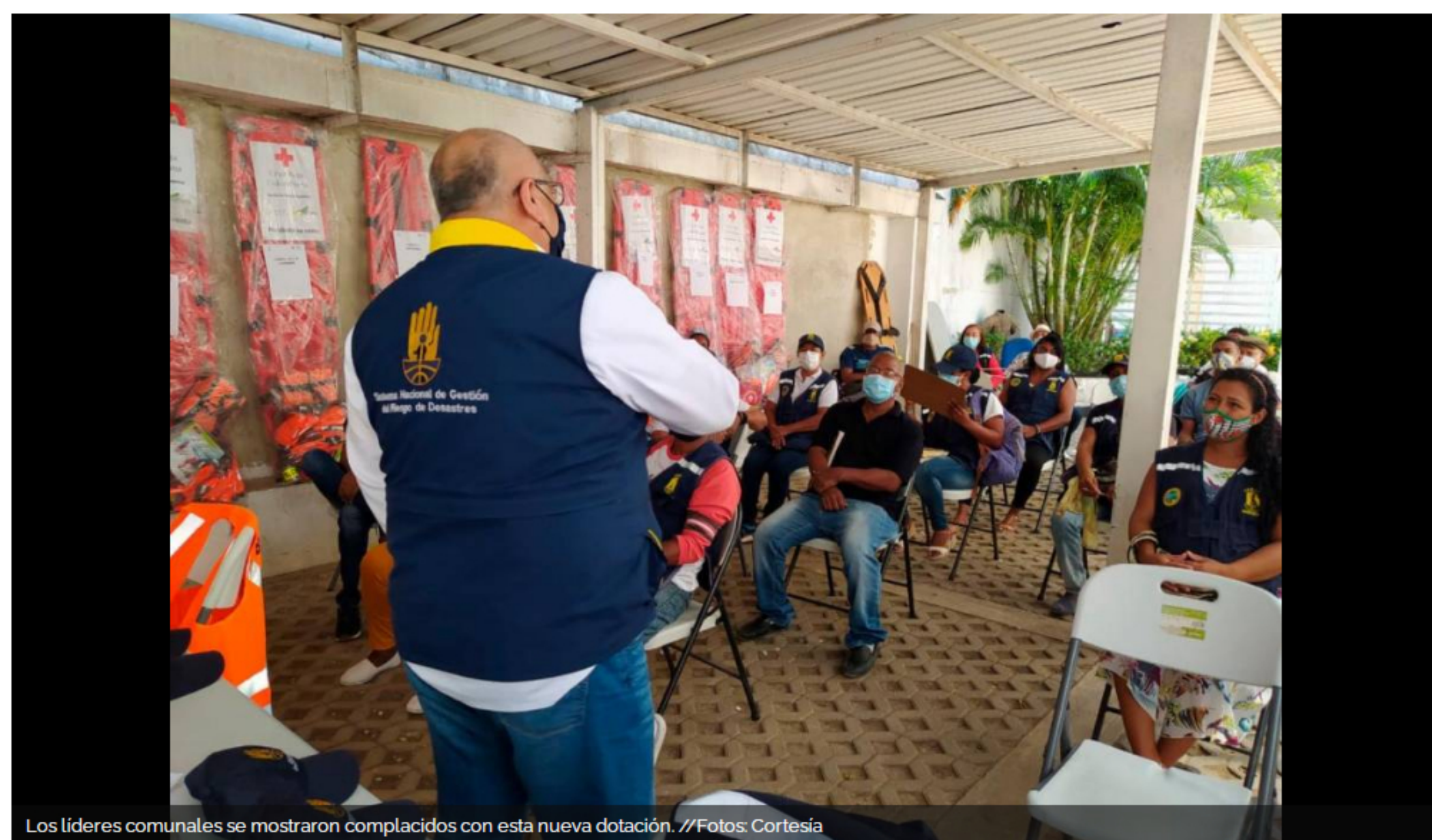
Los líderes comunales se mostraron complacidos con esta nueva dotación.

Dos días después de expedirse el nuevo decreto 0257 de 2021, que fortalece a los Comités Barriales de Emergencia, la Oficina Asesora para la Gestión del Riesgo de Desastres certificó y registró a 16 grupos más.