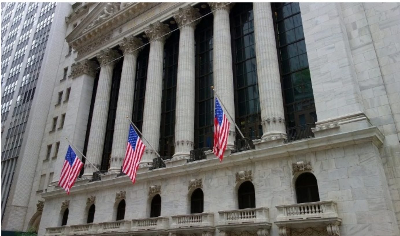
Dow Jones.

Dow Jones cerró este miércoles con nuevos récords, justo después de que el Congreso aprobara el paquete de ayuda de US$1,9 billones que presentó la Casa Blanca