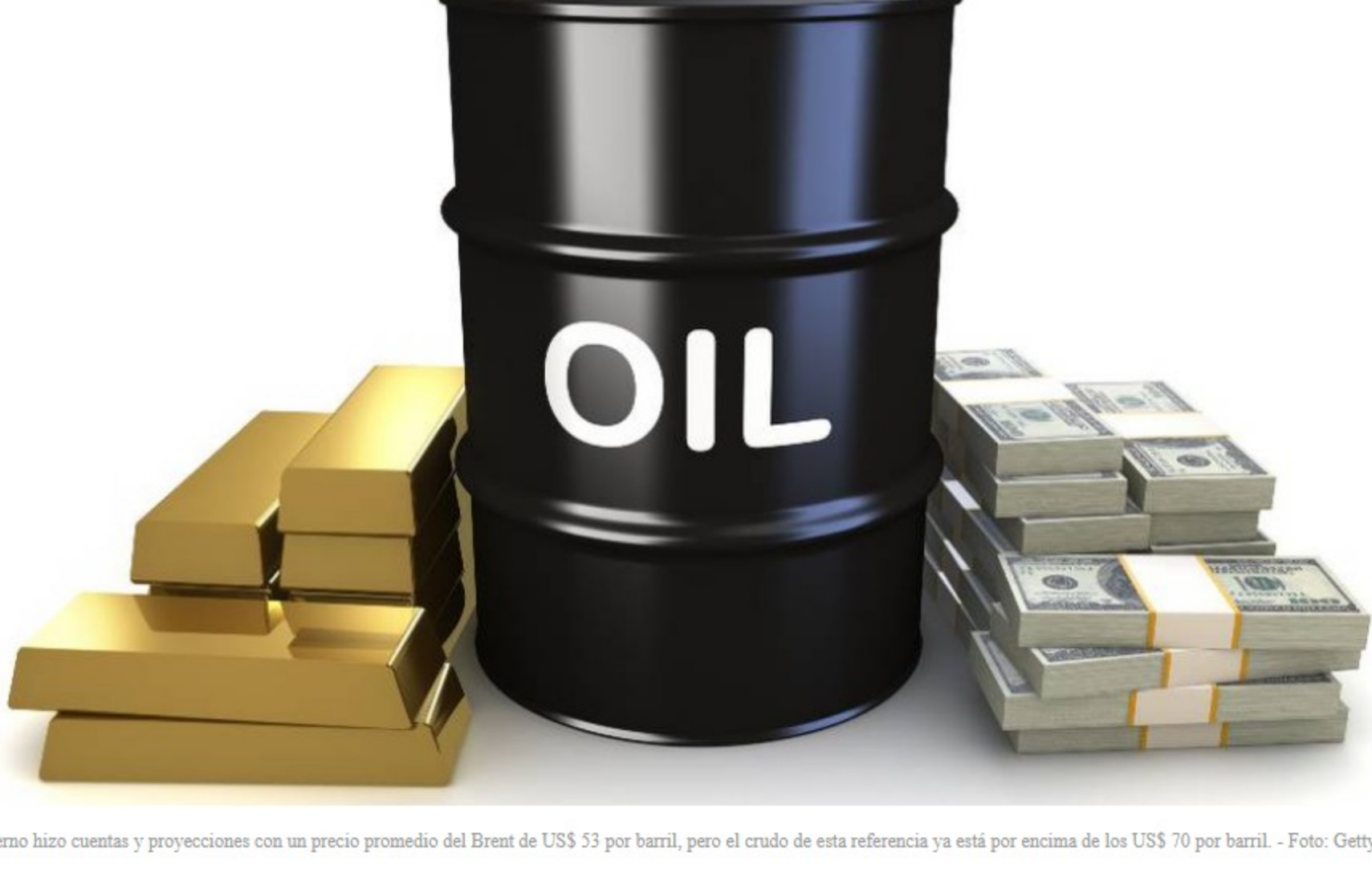
El Gobierno hizo cuentas y proyecciones con un precio promedio del Brent de US$ 53 por barril, pero el crudo de esta referencia ya está por encima de los US$ 70 por barril.

Los precios del petróleo siguen disparados y este domingo volvieron a alcanzar máximos que no se veían desde enero del 2020 , antes de que el mundo sucumbiera ante la pandemia del coronavirus.