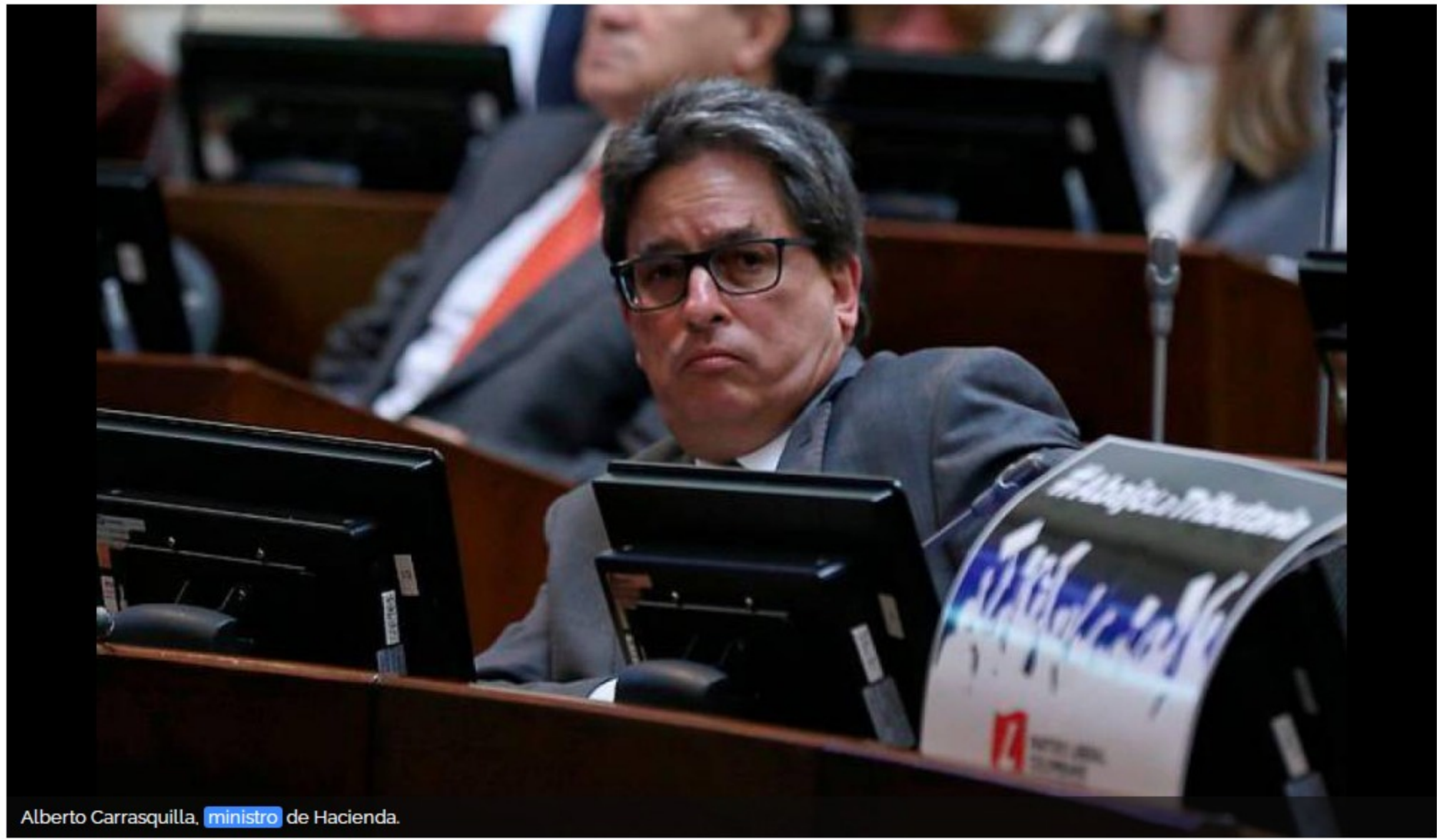
Alberto Carrasquilla, ministro de Hacienda.

El Gobierno hizo sus cálculos teniendo en cuenta el precio del Brent (petróleo) a US$53.