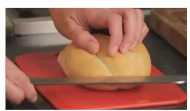
TORTA CAPRESE Sabrosa y rápida torta vegetariana.

En enero, la petrolera estatal Ecopetrol anunció una oferta para adquirir el 51,4% de las acciones en circulación de Interconexión Eléctrica, una operación valorada en 4.000 millones de dólares (3.295 millones de euros) por la agencia de riesgo crediticio Moody's.