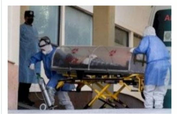
Muertes confirmadas por Covid-19 en México ascienden a 188 mil 866