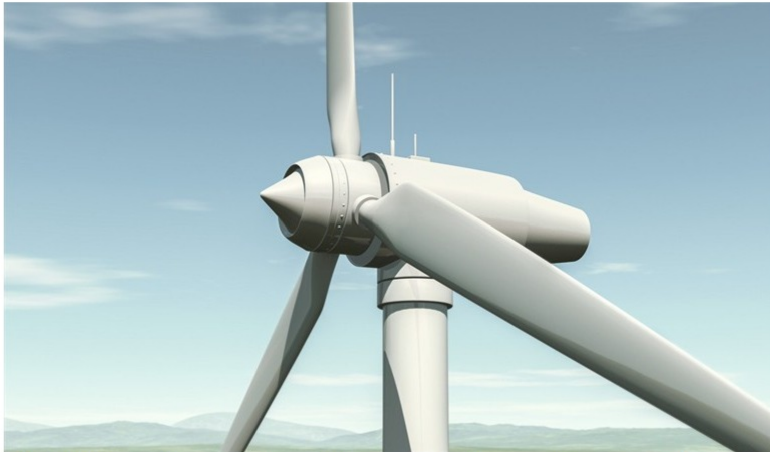
Ecopetrol inició el piloto que busca evaluar si es viable la construcción de parques eólicos en cercanías a la refinería de Cartagena.

La petrolera llevará a cabo pilotos en la refinería de Cartagena, en Huila y Casanare.