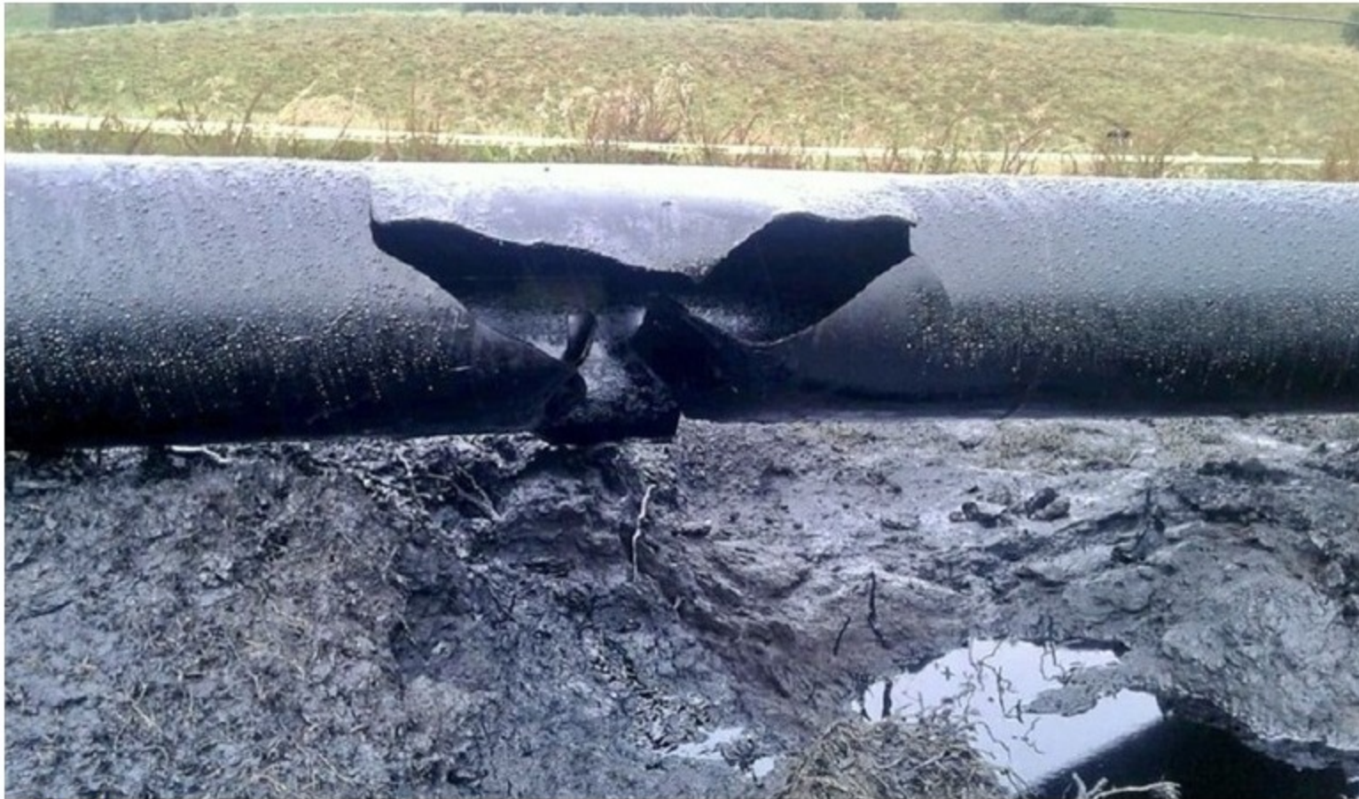
Cenit Logística y Transportes, inició un plan de contingencia como respuesta a la explosión registrada en la vereda Las Bancas.

Con este, ya son 11 los atentados contra la infraestructura petrolera en el departamento de Arauca.