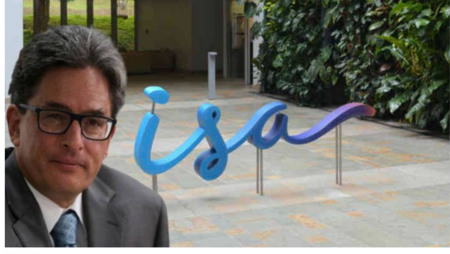
El ministro de Hacienda, Alberto Carrasquilla, reabrió el proceso para vender la participación de la Nación en Interconexión Eléctrica SA (ISA).

Los resultados de la compañía están en línea con las características que han destacado varios expertos en los temas energéticos: que en ISA hay un talante corporativo que la lleva a tener cada vez mejores números.