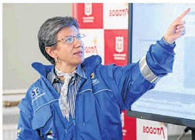
Alcaldía de Bogotá

La Alcaldía de Bogotá presentaría un proyecto tributario ante el Concejo con el que se busca aumentar el impuesto predial que pagan los clubes sociales, una sobretasa a los parqueaderos y además de algunos alivios tributarios. La medida se tomaría porque, según la Administración de Claudia López , hay un desequilibrio entre lo que pagan los ciudadanos y estos empresarios. (AMS)