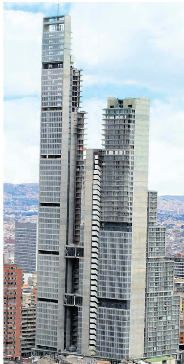
La situación preocupa a los inversionistas.

El proyecto acumula 4 años de atraso y la fiducia dice que la construcción de la torre sur se extendería hasta 2023. Pág. 5