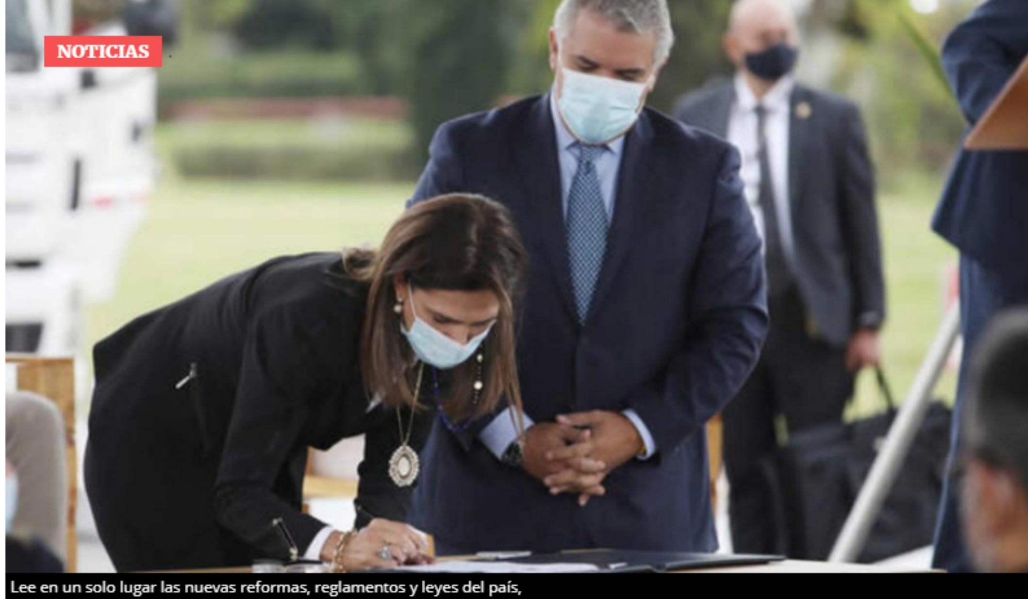
Lee en un solo lugar las nuevas reformas, reglamentos y leyes del país.