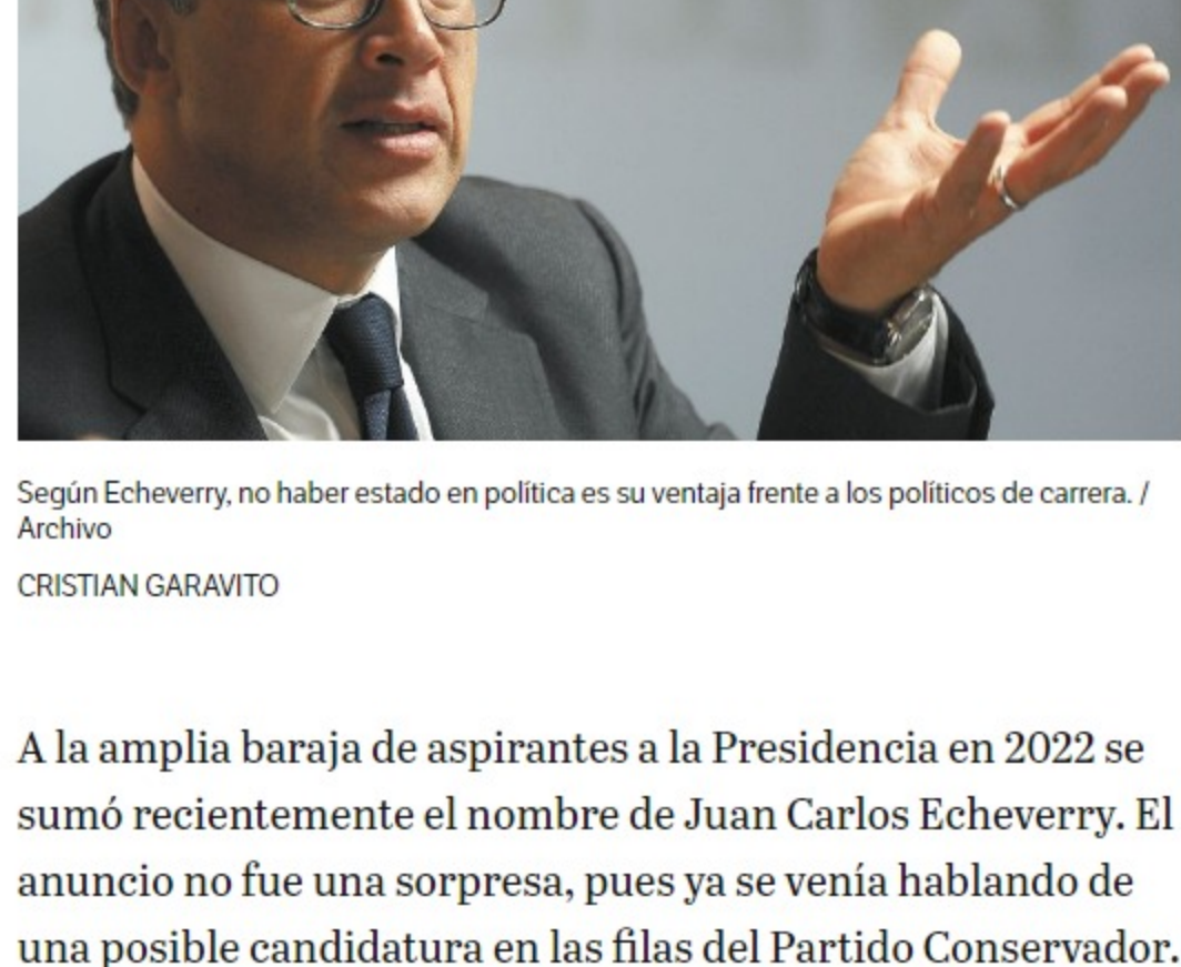
Según Echeverry, no haber estado en política es su ventaja frente a los políticos de carrera.

A la amplia baraja de aspirantes a la Presidencia en 2022 se sumó recientemente el nombre de Juan Carlos Echeverry. El anuncio no fue una sorpresa, pues ya se venía hablando de una posible candidatura en las filas del Partido Conservador. Sin embargo, el exministro de Hacienda decidió irse por firmas y dejó a los conservadores en aprietos, pues de sus oponentes para el aval —entre ellos la vicepresidenta Marta Lucía Ramírez y el hoy embajador en EE. UU., Juan Carlos Pinzón— optaron por permanecer en el Gobierno.