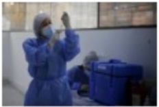
Nuevamente se agotaron las primeras dosis de vacunas en Barrancabermeja

Según el mandatario, esta obra representa el sueño de 200.000 personas y es la forma en que la ciudad le dará la cara al río Magdalena.