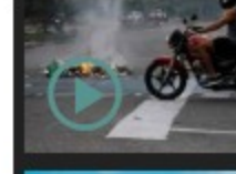
variancias que tienen en alerta a las autoridades en Bucaramanga