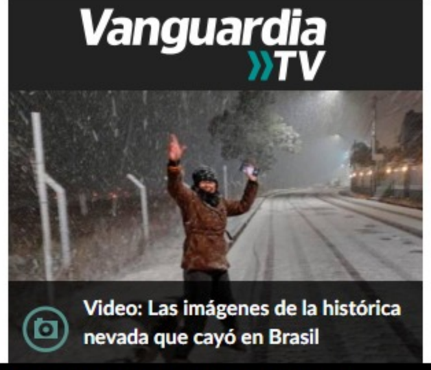
Video: Las imágenes de la histórica nevada que cayó en Brasil