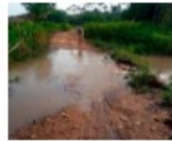
Atienden vías afectadas por temporada invernal

"Es una gran día para la transformación social y vida de los barranqueños, porque hicimos entrega de los estudios y diseños de esta obra y le estamos cumpliendo a nuestra ciudad.