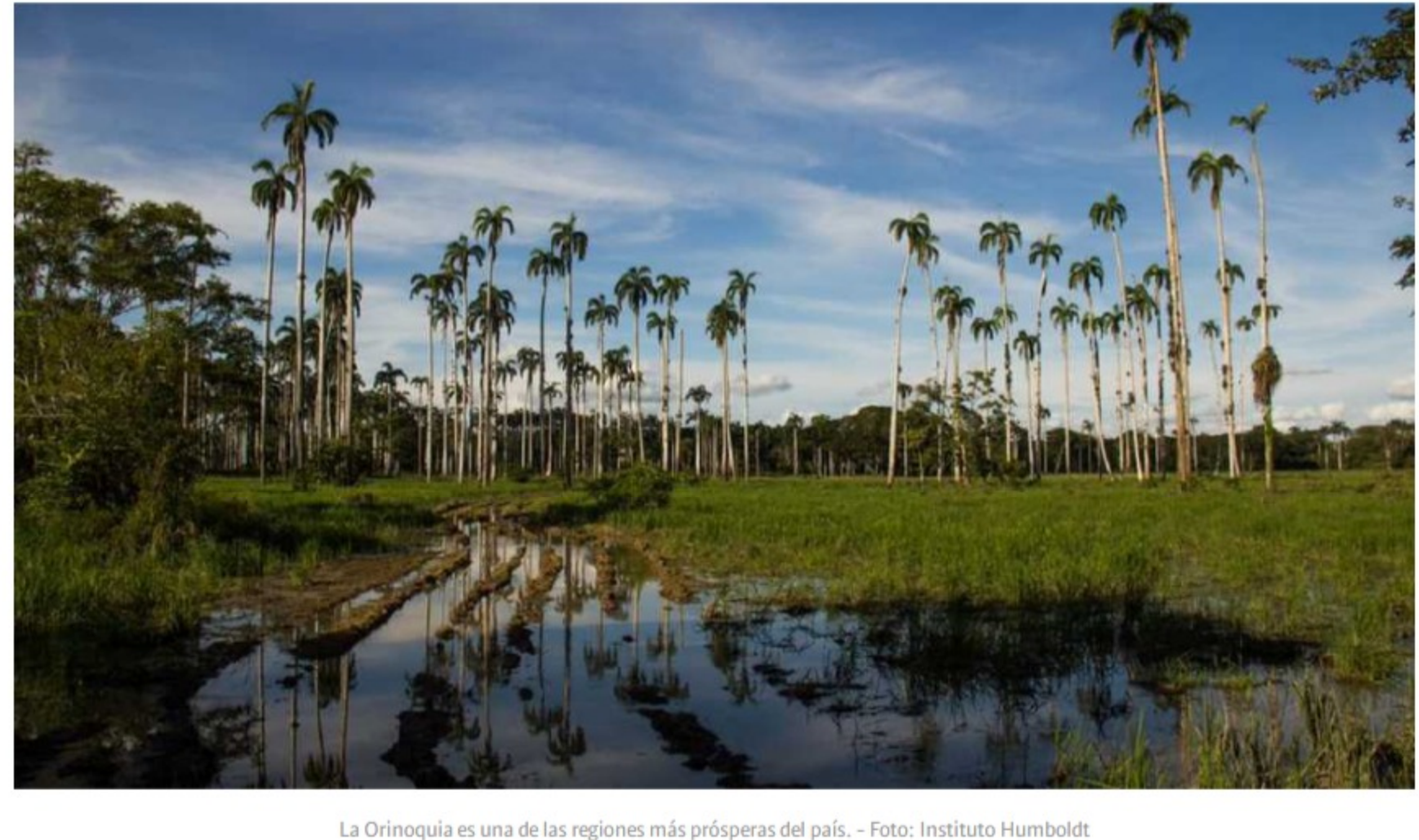
La Orinoquia es una de las regiones más prósperas del país.

De acuerdo con el documento, la Orinoquia es un territorio estratégico para Colombia, pues el 28 % de la producción agrícola nacional y el 20 % del hato ganadero se encuentran en sus paisajes. Además, se estima que cuenta con el 70 % de las reservas de petróleo y se considera la “última gran frontera que le queda al país para el desarrollo agroindustrial.