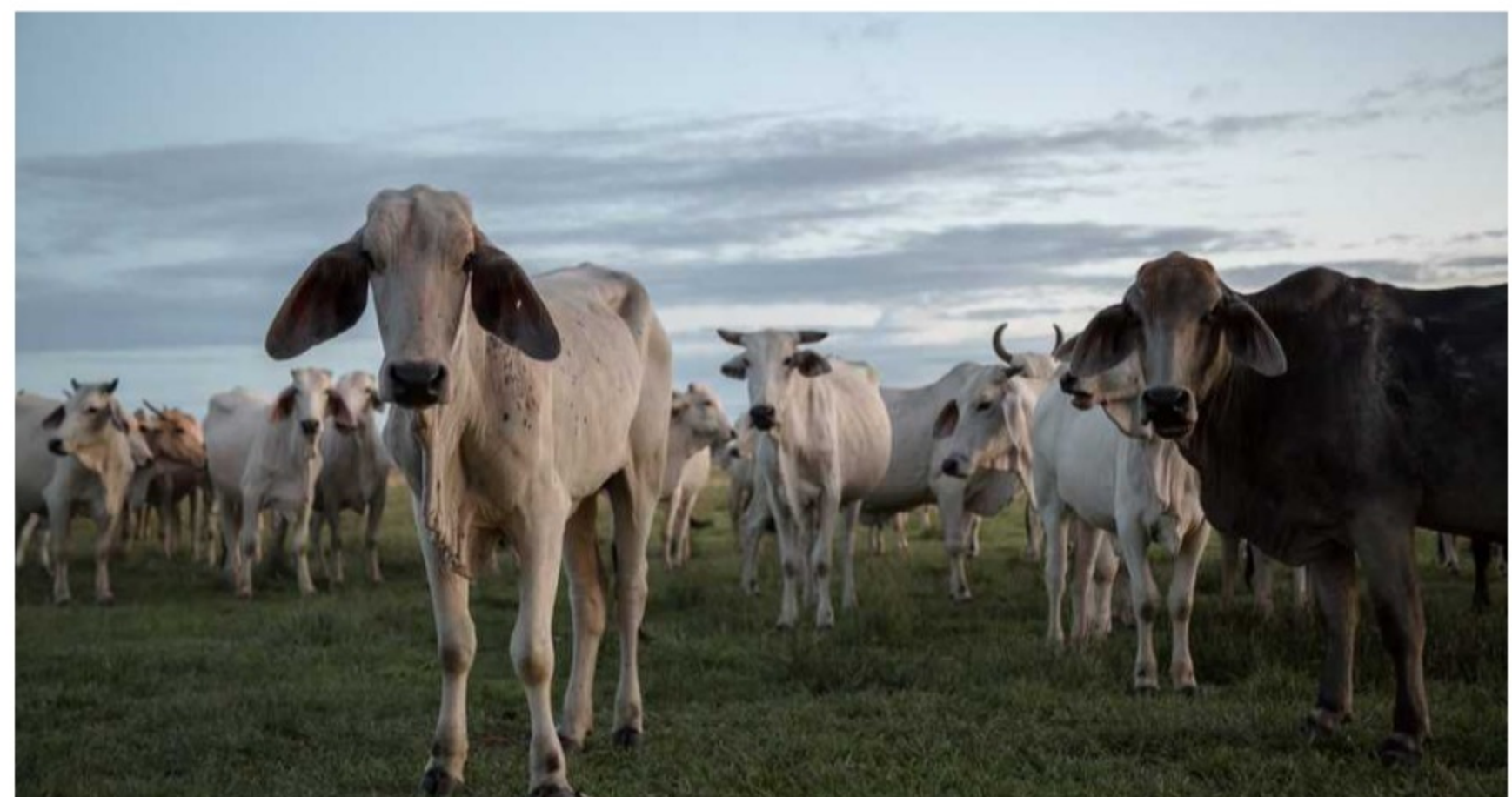
La ganadería es una de las principales actividades productivas en la Orinoquia.

En el manifiesto, las organizaciones destacan que es posible lograr sistemas rentables y sostenibles que contribuyan a la seguridad alimentaria del país y que, además, favorezcan a la conservación de la biodiversidad y el recurso hídrico; pero insisten en que esto sólo se alcanzará como resultado de una planificación conjunta de los sistemas productivos, priorizando, entre otras, la diversificación de la producción.