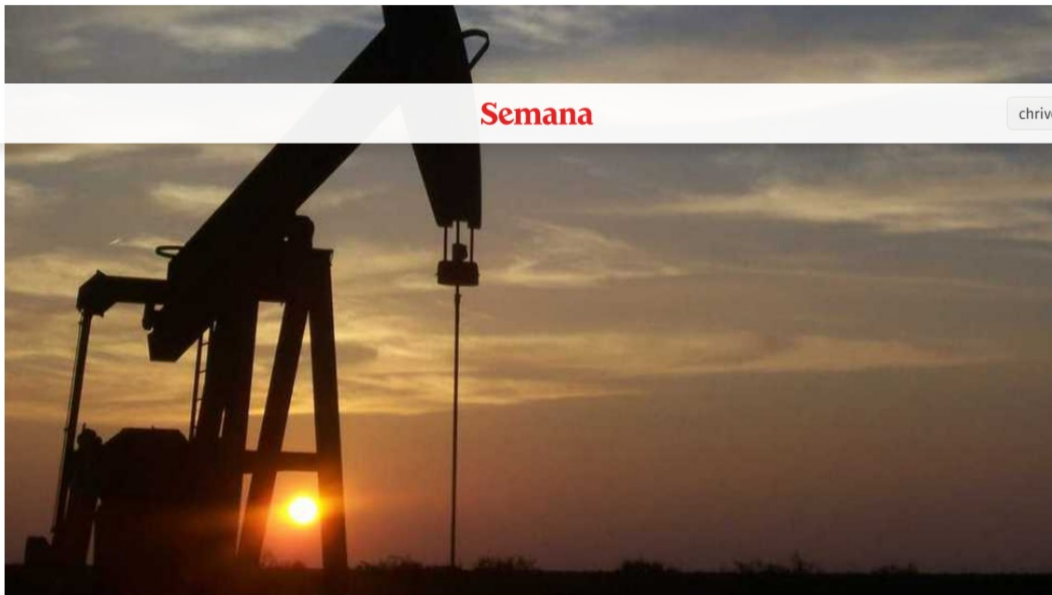
Petróleo - Foto:

El precio del petróleo cerró en verde este jueves 29 de julio después de conocerse que las reservas de crudo de Estados Unidos bajaron 4,1 millones de barriles a 435,6 millones de barriles, según el más reciente informe de la Agencia estadounidense de Información sobre Energía (EIA)