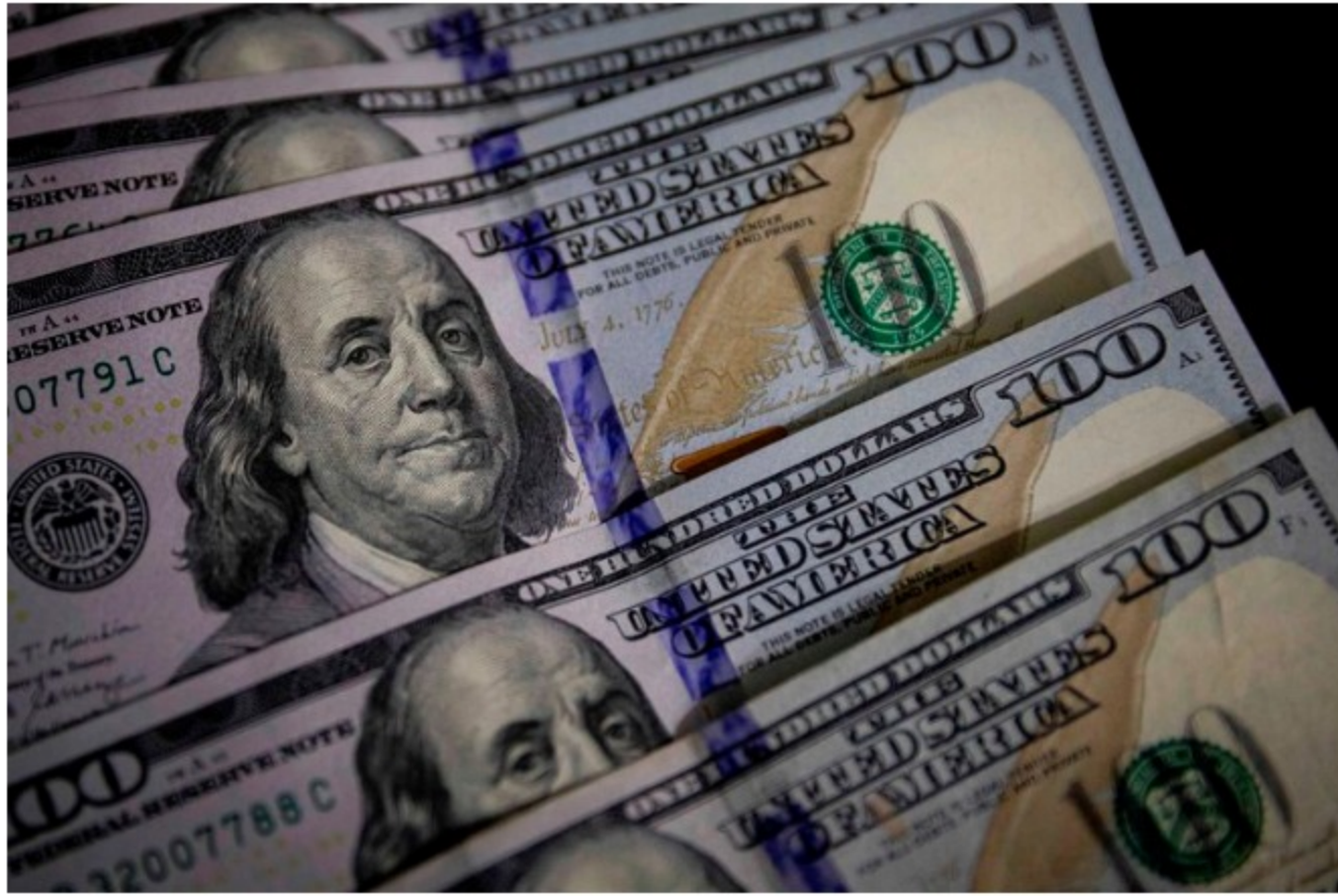
La rueda de negocios fue organizada por KITA, la asociación empresarial más importante del país asiático y el Ministerio Surcoreano de Pymes y Startups (MSS), y en ella participaron fabricantes y proveedores líderes en Corea del Sur.

Este martes 27 de julio, el dólar en Colombia alcanzó el precio más alto que se ha registrado durante este año con una cotización superior a los $3.900 pesos durante la jornada, lo que evidencia algunas dinámicas internacionales como el pronóstico de una importante inflación en Estados Unidos y nacionales como el paro nacional.