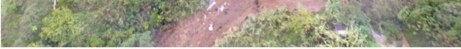
Varias veredas incomunicadas dejó la avenida torrencial