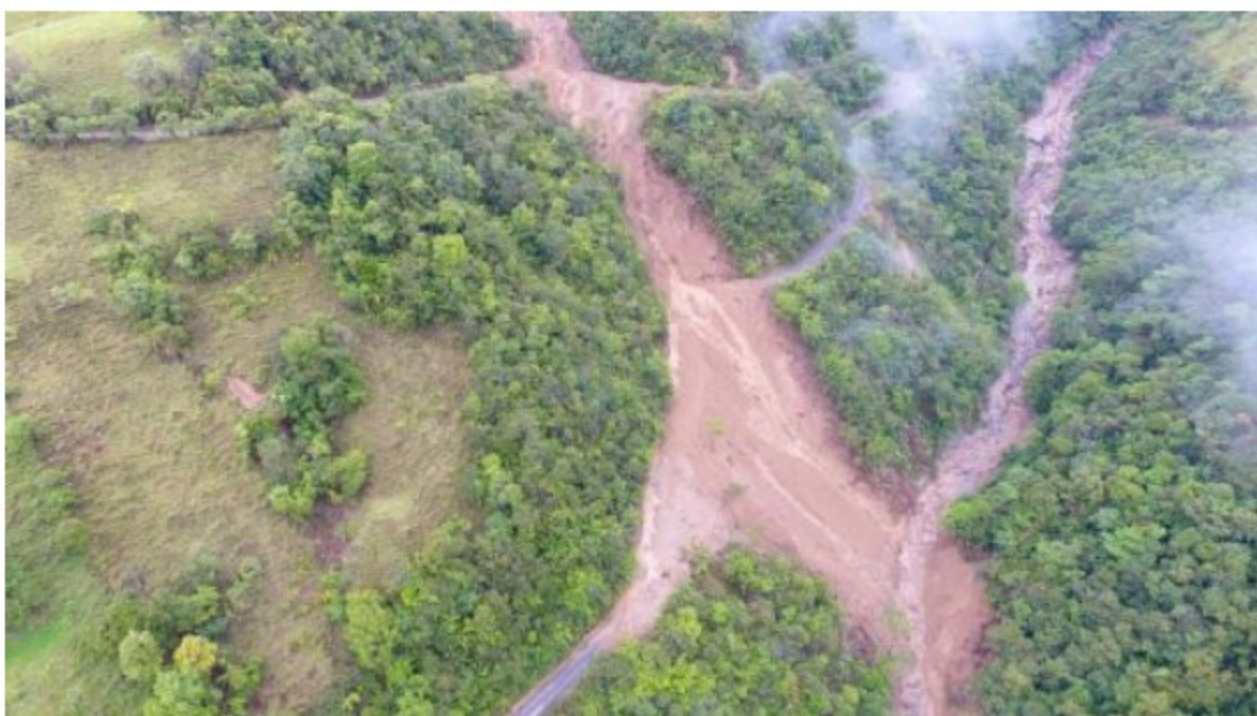
Avenida torrencial

Una comisión en cabeza del gobernador de Nariño Jhon Rojas hizo presencia en la zona con el fin de apoyar la atención de la emergencia y se determinó el envío de la maquinaria del departamento para remover el material que mantiene incomunicadas a varias poblaciones.