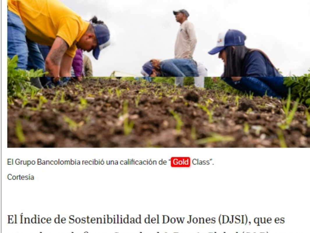
El Grupo Bancolombia recibió una calificación de Gold Class .

El Índice de Sostenibilidad del Dow Jones (DJSI), que es operado por la firma Standard & Poor's Global (S&P), es un sistema independiente que verifica los criterios económicos, sociales y ambientales más relevantes de las principales empresas del mundo.