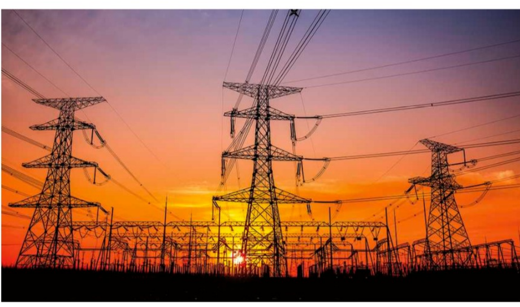
ISA conexiones.

El segundo reto consiste en retomar la estrategia de desinversión de algunos de sus negocios, y, con ello, enfocarse y mantener indicadores, como, por ejemplo, deuda/ebitda. Piensa vender su participación en ISA –de 8,82 por ciento y que, según la capitalización bursátil, valdría 2,2 billones de pesos–, aprovechando la operación de Ecopetrol al adquirir el 51,4 por ciento que tiene el Gobierno en esa empresa. Está consultando con la petrolera para definir si le interesa quedarse con esa participación.