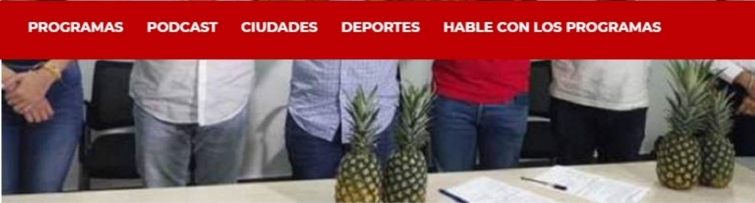
Firma del convenio para compra de piñas en el Huila.