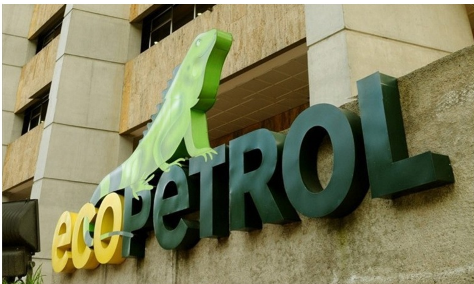
En junio Ecopetrol logró incrementar 81% la actividad de sus proyectos.

Con la reactivación lograda en los proyectos de la estatal, también se logró dar un empujón al empleo en varias regiones del país.