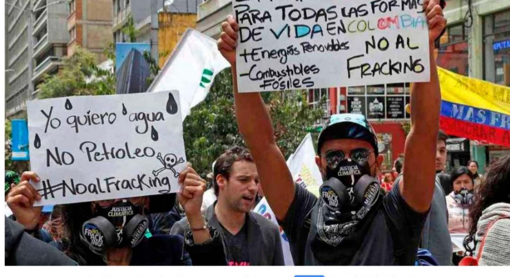
Los defensores del medio ambiente se oponen a prácticas como el fracking.

Estas metas fueron anunciadas en diciembre de 2020 en la Convención Marco de Naciones Unidas sobre el Cambio Climático, y están consignadas en la Contribución Nacionalmente Determinada (NDC por sus siglas en inglés), la hoja de ruta a través de la cual el país pretende alcanzarlas.