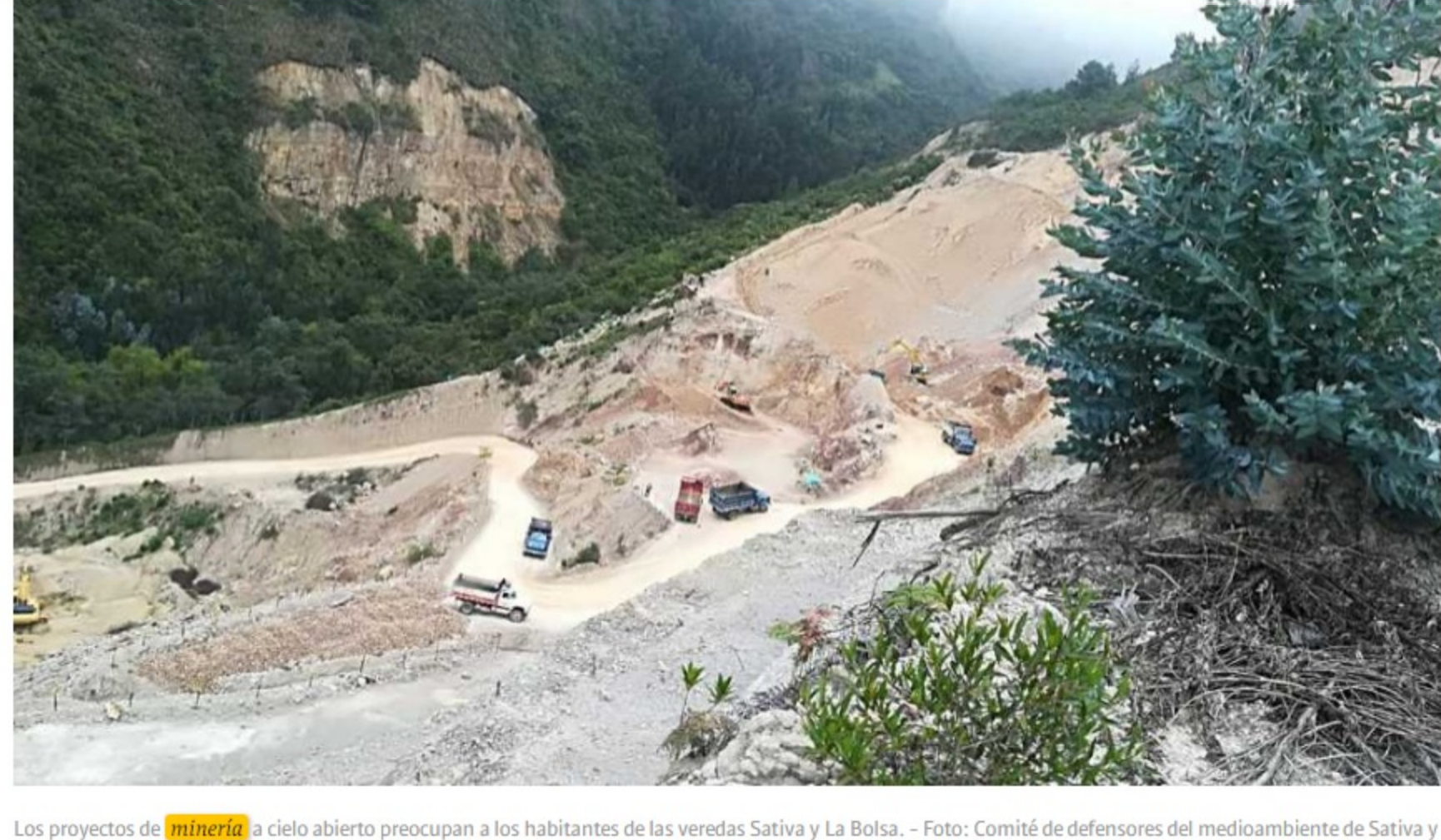
Los proyectos de minería a cielo abierto preocupan a los habitantes de las veredas Sativa y La Bolsa.

La iniciativa presentada por Losada le otorga herramientas al Estado y a las comunidades para conservar y proteger los bosques de palma de cera, y las diferentes especies que lo componen, atendiendo a su relevancia ecosistémica.