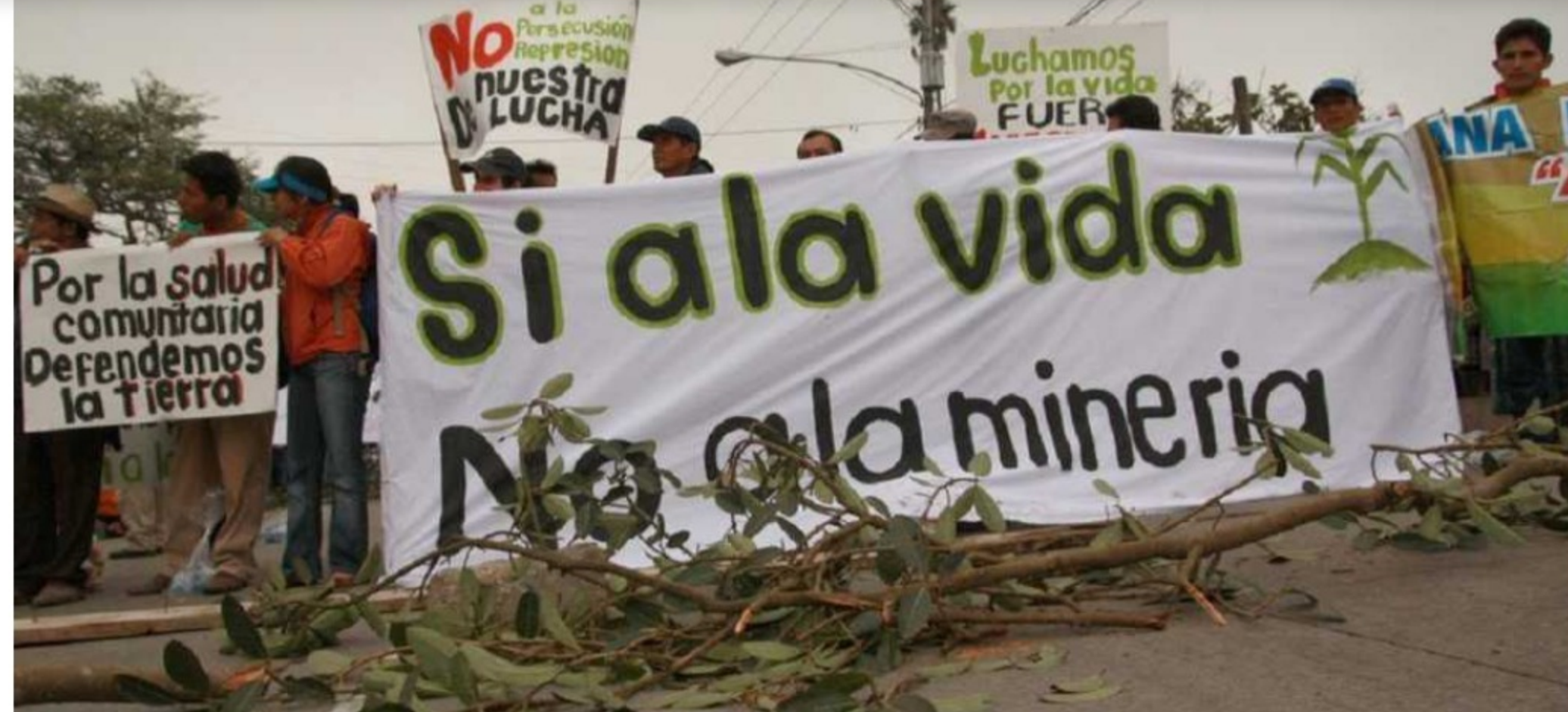
Comunidades de diferentes municipios de Boyacá se oponen al desarrollo de proyectos mineros.

Trazabilidad de la carne, protección de la palma de cera, participación ciudadana en contextos extractivos, regulación del uso de animales en protestas y prohibición de la pólvora, estas son algunas de las iniciativas ambientales presentadas al Congreso y que tras el fiasco en la ratificación del acuerdo de Escazú, esperan algo de buena voluntad por parte del legislativo.