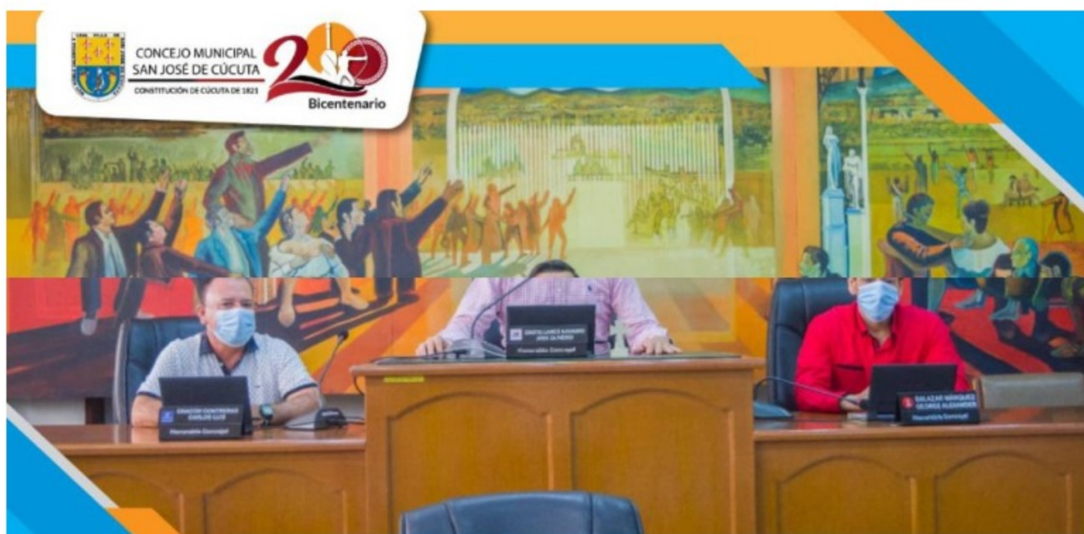
Mesa directiva 2022

Opiniones divididas al interior de la corporación