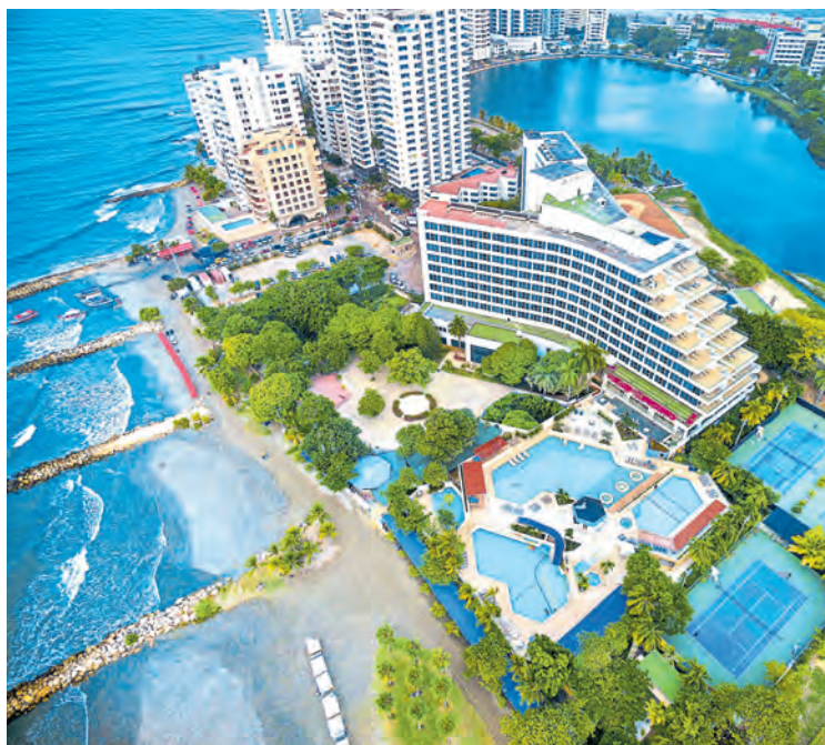
Establecimientos del país han crecido 0,4% en lo que va del 2021.

Gracias a su bonanza en los hidrocarburos, atrae la atención de firmas de toda la región. Pág. 8