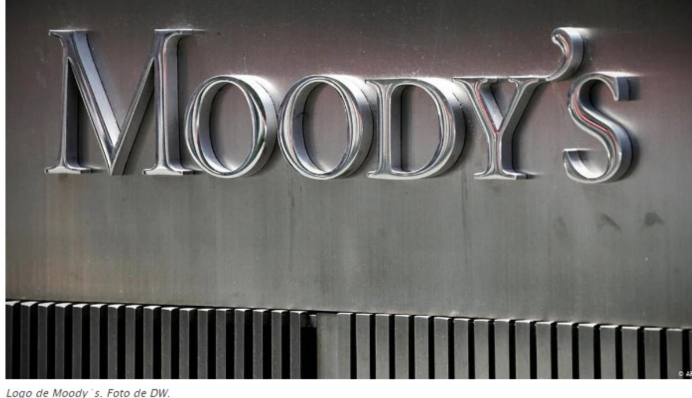
Logo de Moody´s.

En mayo, S&P Global Ratings rebajó la calificación de Colombia y la misma decisión tomó Fitch en julio pasado.