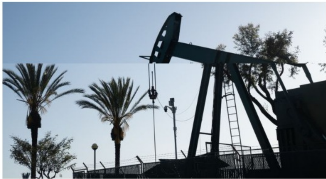
OPEP espera la recuperación del precio del petróleo .