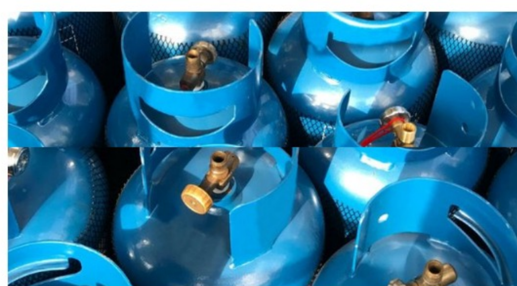
Advierten alza en el precio del gas propano o GLP