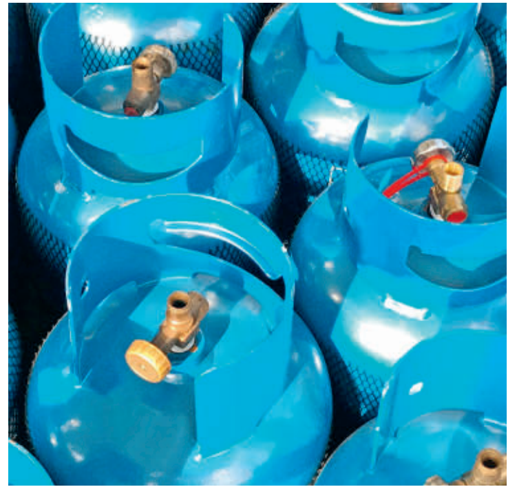
Gasnova sostuvo que ayer se aplicó un nuevo incremento en el precio regulado del GLP en Colombia.

No obstante, los empresarios siguen preocupándose por asuntos como el encarecimiento del transporte (el marítimo se triplicó en este año), lo que les ha pasado factura en sus cuentas de logística, llevando incluso a desabastecimiento ■