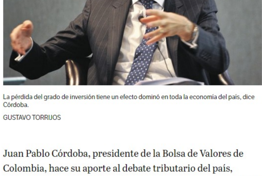
La pérdida del grado de inversión tiene un efecto dominó en toda la economía del país, dice Córdoba