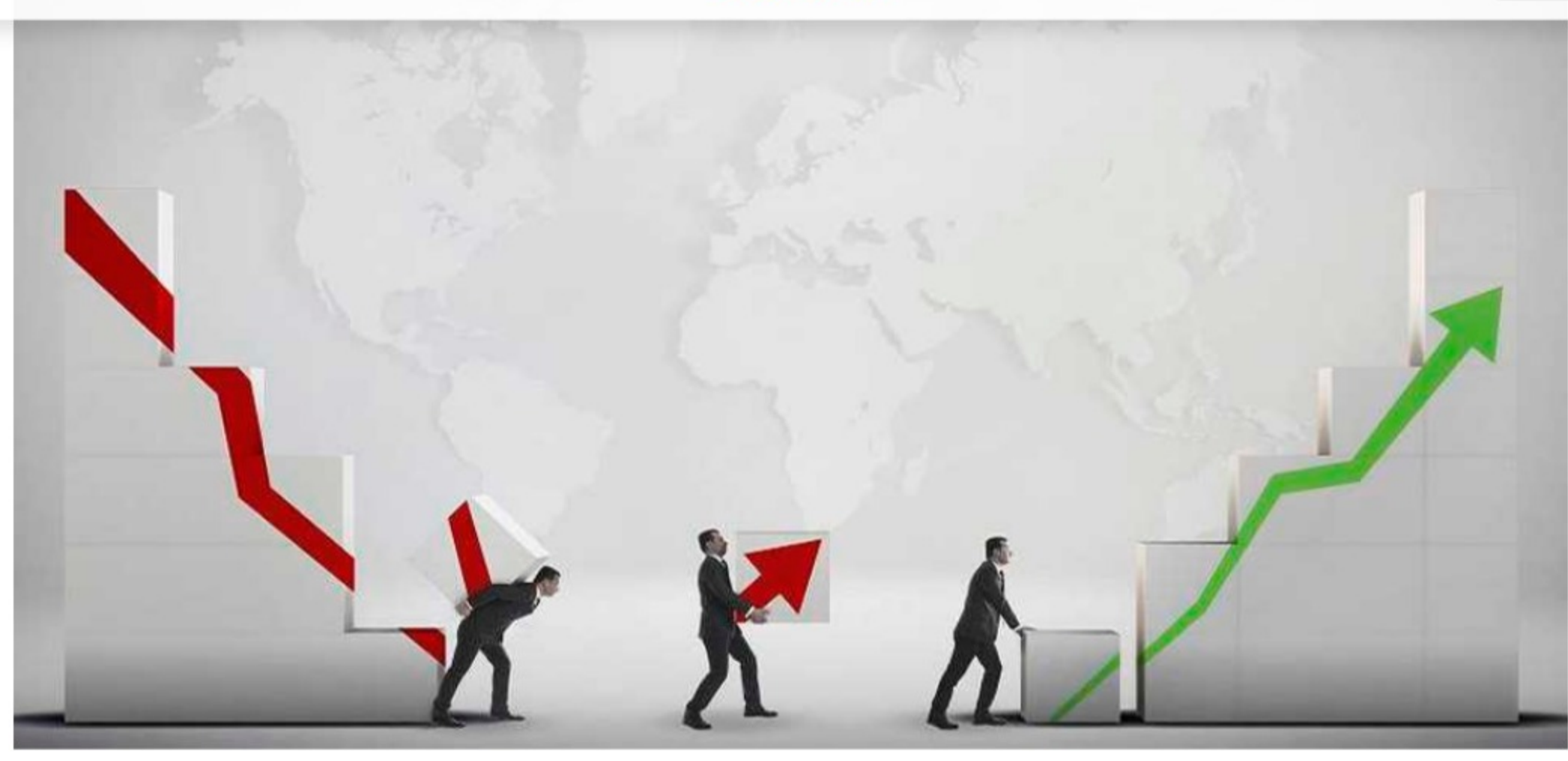
PIB de Colombia, el segundo de la Oede que más cayó en el tercer trimestre.

El equipo de investigaciones económicas de Bancolombia reveló los más recientes datos del índice Nowcast en el cual se evidencia que, según las estimaciones, la economía colombiana creció 13 % en junio de este año.