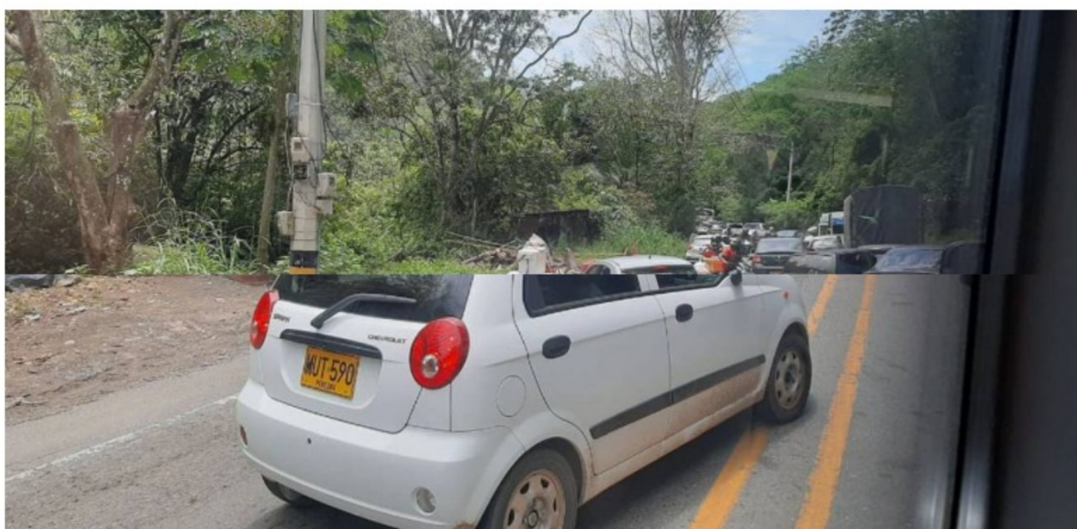
Filas del pare y siga entre La Felisa y La Pintada

Entre La Pintada y La Felisa son 46 kilómetros de obras con esperas de entre 3 y 4 horas.