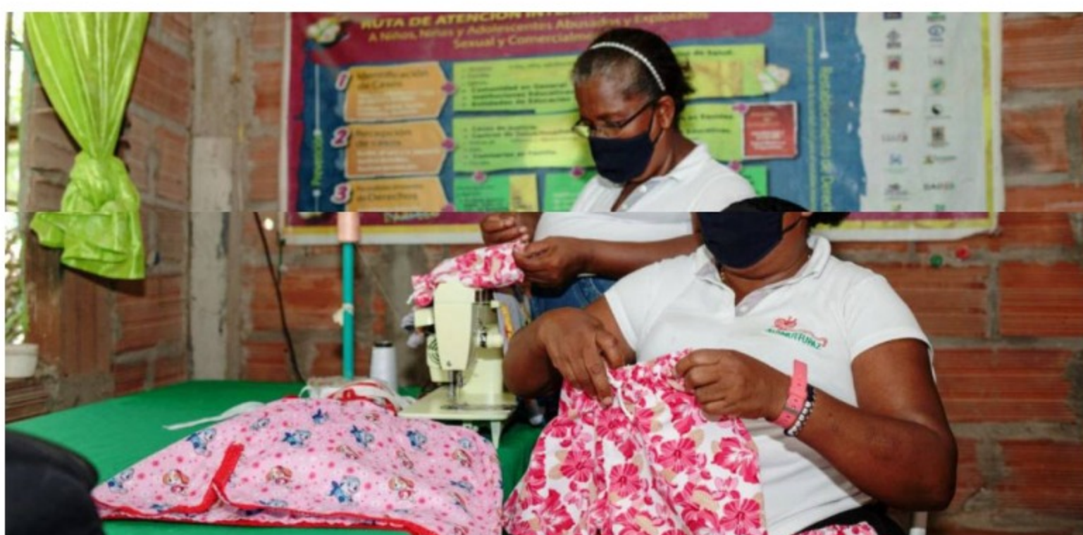
400 mipymes beneficiadas con programa de apoyo de Ecopetrol y Créame

Un total de 28 mipymes del Caribe ingresaron al programa, 18 están ubicadas en Cartagena, Bolívar