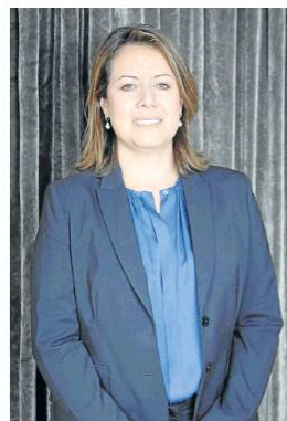
María Ximena Lombana, ministra de la cartera de Comercio, Industria y Turismo.

BOGOTÁ El Ministerio de Comercio, Industria y Turismo reportó que entre enero y mayo de 2021, las exportaciones de bienes no minero energéticos sumaron US$6.918 millones, el valor más alto para los primeros cinco meses desde 2008.