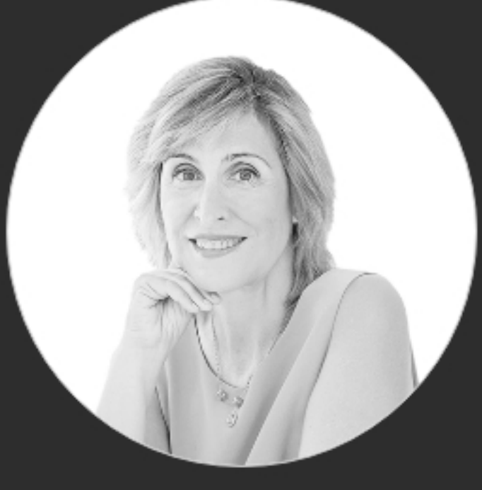
ANALISTAS | 06/07/2021