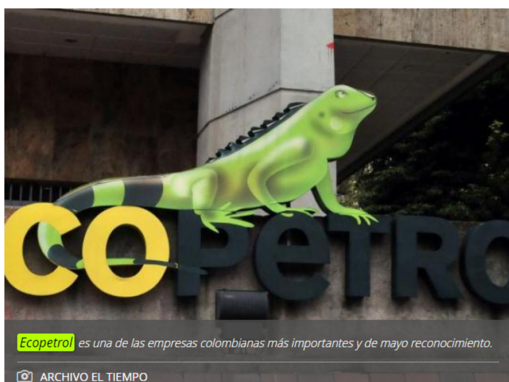
Ecopetrol es una de las empresas colombianas más importantes y de mayor reconocimiento.