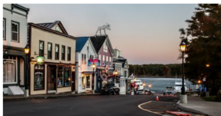
Biden backs Maine town saying no to WWII-era Canadian pipeline