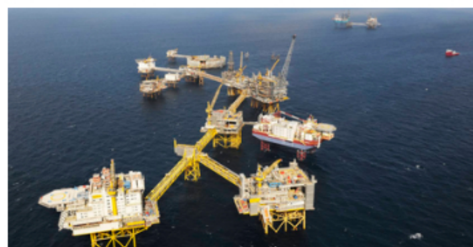
El fondo noruego de 1,4 billones de dólares advierte que los objetivos