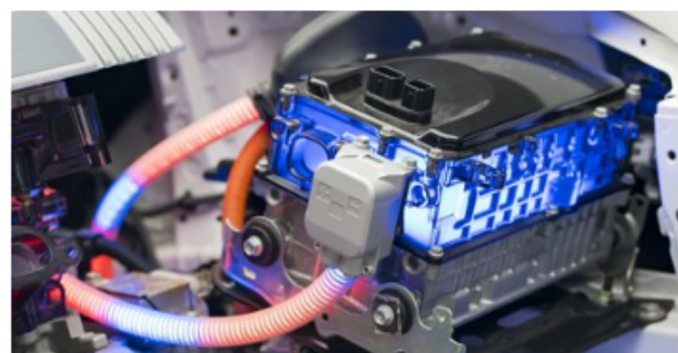
Lithium nationalism is taking root in region with most resources