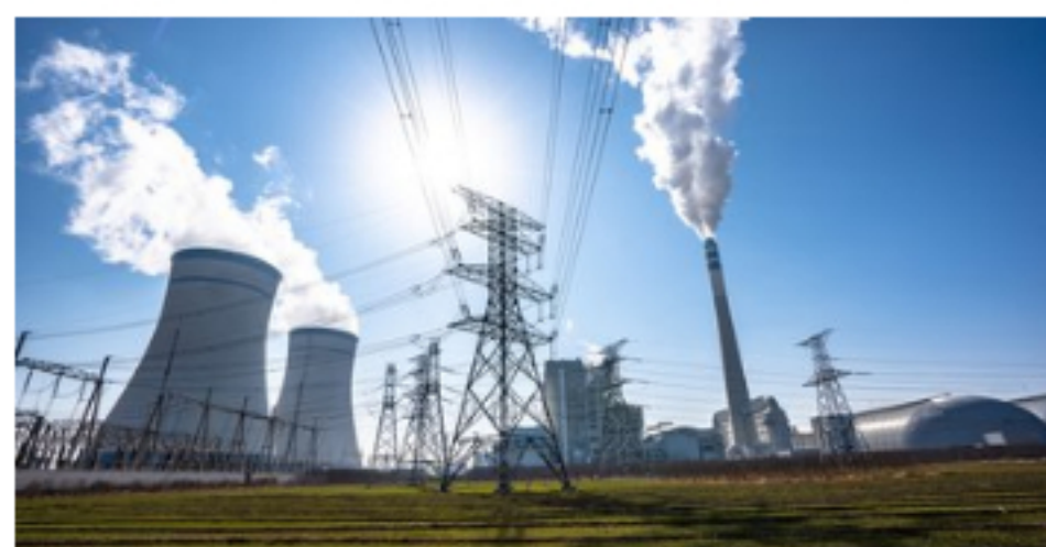
Saudi Arabia wants to freeze carbon to cut emissions from power