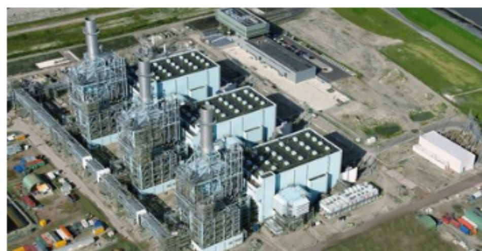
Baker Hughes takes a stake in synthetic natural gas startup