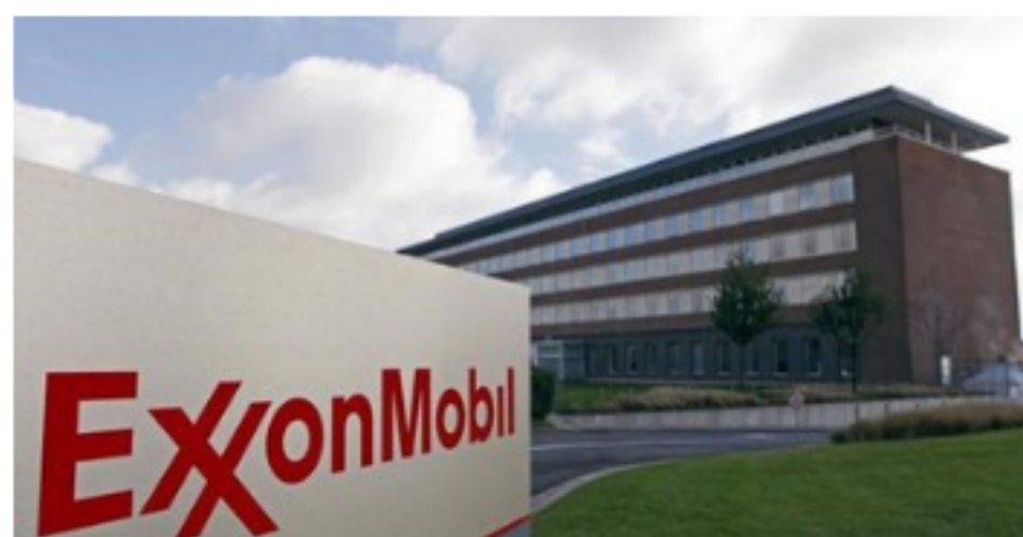
Exxon delegate faces eviction from global tax transparency group